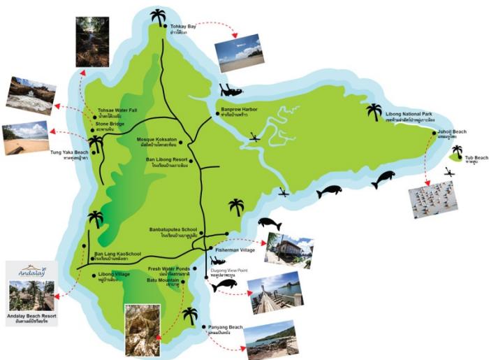
ภาพที่ ๓ แผนที่แหล่งท่องเที่ยวเกาะลิบง