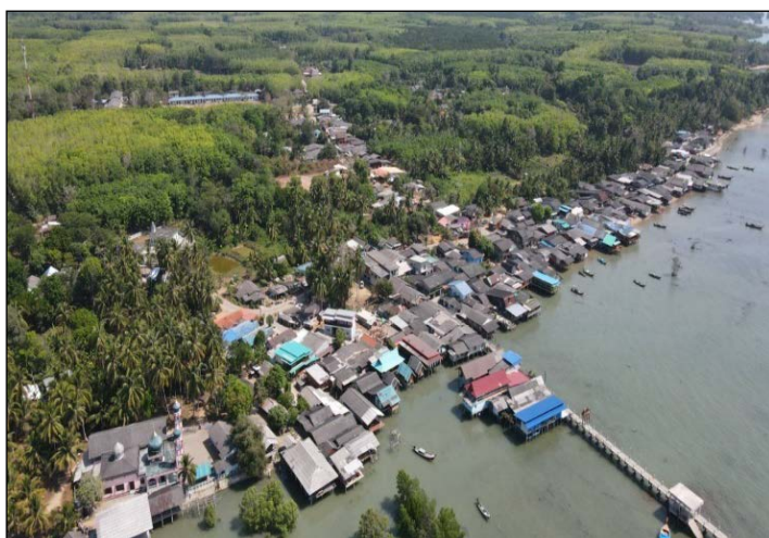
ภาพที่ ๑ สภาพภูมิประเทศ และความอุดมสมบูรณ์ด้านทรัพยากรทางธรรมชาติของเกาะลิบง อำเภอกันตัง จังหวัดตรัง