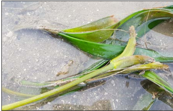
ภาพที่ ๕ ระบบนิเวศหญ้าทะเล