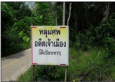
ภาพที่ ๙ กิจกรรมการท่องเที่ยวด้านทรัพยากรทางประวัติศาสตร์