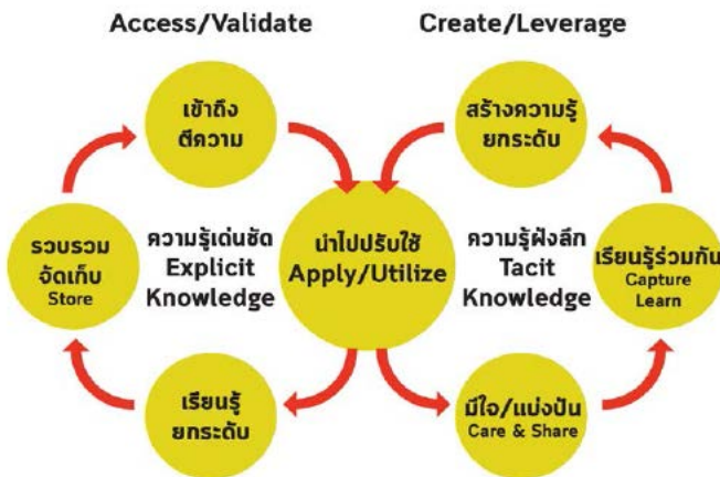
ภาพที่ ๒ วงจรการเรียนรู้

นักจัดการความรู้ ต้องมีความเชื่อพื้นฐานร่วมกันว่า ความรู้ที่ฝังลึกในตัวบุคคล (Tacit Knowledge) สามารถบันทึก หรือถ่ายทอดให้เป็นความรู้ที่ชัดแจ้งได้ (Explicit Knowledge) หรืออาศัยกลไก เครื่องมือการจัดการความรู้เพื่อการแลกเปลี่ยนเรียนรู้ให้คนได้พบกัน มีความไว้วางใจกัน และถ่ายทอดความรู้ให้กันและกัน ความรู้ทั้งสองประเภทมีความสัมพันธ์กัน หมุนเวียนเปลี่ยนกลับไปกลับมาได้ ซึ่งเรียกว่า วงจรการเรียนรู้ ดังแผนภาพ