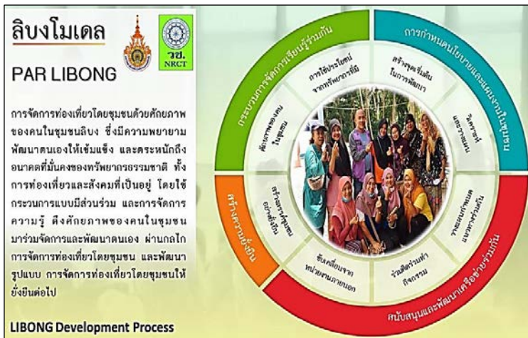
ภาพที่ ๑๐ รูปแบบการขับเคลื่อน Libong Model

โดยกระบวนการเสริมสร้างการมีส่วนร่วมชุมชนเกาะลิบง ประกอบด้วย