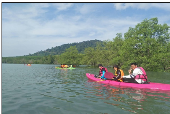
ภาพที่ ๖ กิจกรรมท่องเที่ยวด้านทรัพยากรสิ่งแวดล้อม

ด้วยสภาพภูมิประเทศที่มีความต่างกันภายในเกาะลิบง ได้สร้างระบบนิเวศที่มีความหลากหลาย มีทั้ง ป่าบก ป่าชายหาด ป่าชายเลน ภูเขา ทะเล ปะการัง ทำให้เกาะลิบงเป็นพื้นที่ที่มีความหลากหลายทางชีวภาพสูง พร้อมให้ผู้สนใจได้มาเรียนรู้และศึกษาระบบนิเวศ โดยสามารถจัดกิจกรรมท่องเที่ยวทางนิเวศ เช่น การเดินศึกษาธรรมชาติ การดูนก ดูพะยูน พายเรือคายัก/แคนู เพื่อศึกษาระบบนิเวศป่าชายเลน ซึ่งสามารถระบุแหล่งท่องเที่ยวทางธรรมชาติของเกาะลิบง