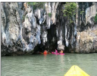
ภาพที่ ๗ แหล่งท่องเที่ยวทางทรัพยากรธรรมชาติสิ่งแวดล้อม