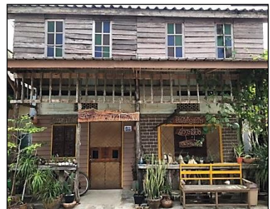
ภาพที่ ๘ กิจกรรมการท่องเที่ยวด้านวิถีชีวิตและวัฒนธรรม