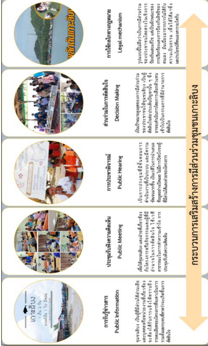
ภาพที่ ๑๑ กระบวนการเสริมสร้างการมีส่วนร่วมชุมชนเกาะลันตา