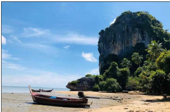
ภาพที่ ๔ ทรัพยากรทางธรรมชาติสิ่งแวดล้อม