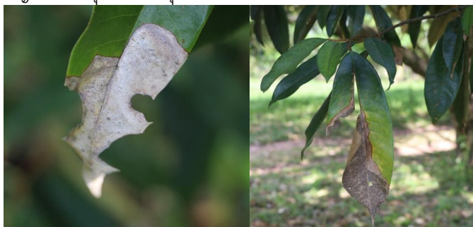
ภาพที่ 4 โรคใบไหม้

4. โรคใบไหม้ โรคใบไหม้เป็นโรคที่พบระบาดอย่างกว้างขวางในช่วงไม่กี่ปีมานี้ ส่วนใหญ่เป็นกับทุเรียนพันธุ์ชะนีและหมอนทอง