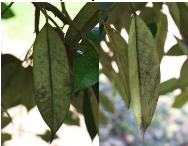
ภาพที่ 7 ไรแดง