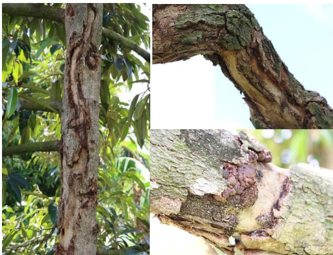
ภาพที่ 5 หนอนเจาะลำต้นทุเรียน