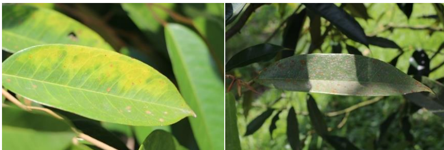
ภาพที่ 2 โรคงูดสนิม