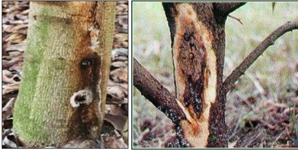
ภาพที่ 1 โรครากเน่าและโคนเน่า