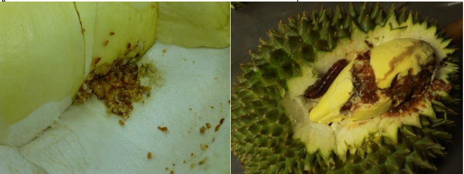
ภาพที่ 6 หนอนเจาะเมล็ดทุเรียน

หนอนเจาะเมล็ดทุเรียน มีชื่อเรียกหลายชื่อ เช่น หนอนรู หนอนมาเลย์ หรือหนอนใต้ สันนิษฐานว่าเดิมเป็นแมลงที่ระบาดแถวประเทศมาเลเซีย แล้วระบาดลุกลามไปทั่วทุกแห่งปลูกทุเรียนในประเทศไทย ตัวเต็มวัยของหนอนเจาะเมล็ดทุเรียนเป็นผีเสื้อกลางคืนอยู่ในวงศ์นี้่อกทูดี้ (Noctuidae) หนอนชนิดนี้เมื่อเข้าทำลายผลทุเรียนจะไม่สามารถสังเกตได้จากภายนอกได้ หนอนที่เจาะเข้าไปในผลทุเรียนถ่ายมูลออกมาปะปนอยู่กับเนื้อทุเรียน ทำให้เนื้อทุเรียนเสียคุณภาพ หนอนจะอยู่ในผลทุเรียนจนกระทั่งเมื่อหนอนโตเต็มที่พร้อมเข้าดักแด้ จะเจาะเปลือกเป็นรูออกมาและทิ้งตัวลงบนพื้นดินเพื่อเข้าดักแด้ในดิน (สุเทพ, 2560)