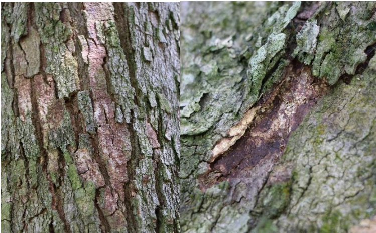
ภาพที่ 3 โรคราสีชมพู

3. โรคราสีชมพู จะทำความเสียหายในแหล่งปลูกที่มีความชื้นสูง โดยเฉพาะในช่วงฤดูฝน และระบาดได้รุนแรงในสวนที่ไม่ได้รับการดูแลรักษาที่ดี โรคนี้เกิดจากเชื้อราคอร์ทีเซียม ( Corticium salmonicolor ) สามารถเข้าทำลายกิ่งทุเรียนทำให้เกิดอาการกิ่งแห้ง ใบเหลืองร่วง และมีกระบาดมากกับต้นทุเรียนที่มีทรงพุ่มหนาทึบ