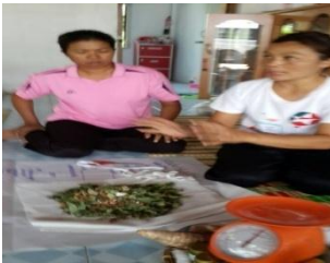
ภาพที่ 1 ขั้นตอนการสับสมุนไพร

ล้างสมุนไพรให้สะอาด หั่นเป็นชิ้นเล็ก ๆ โขลกพอแหลก ใส่เกลือป่น พิมเสน การบูร คลุกให้เข้ากัน