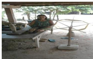
ภาพที่ 2 การกรอฝ้ายใส่อঁก