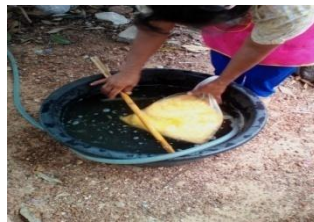
ภาพที่ 2 ล้างไหมด้วยน้ำสะอาด