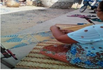
ภาพที่ 6 การมัดหมี่