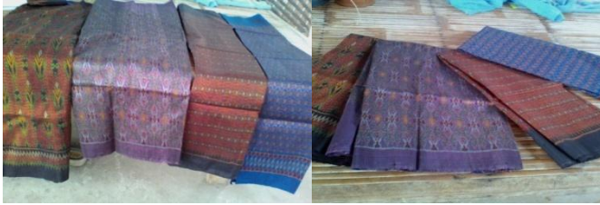
ภาพที่ 12 ผลิตภัณฑ์ผ้าไหมมัดหมี่บ้านลาดนาเพียง