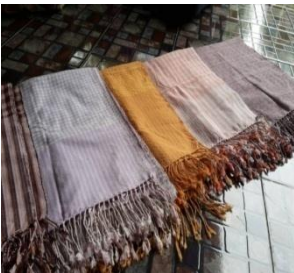
ภาพที่ 7 ผ้าขาวม้าอ่อนกประสงค์

โดยเส้นฝ้ายที่ได้จากการทอด้วยความประณีตละเอียดอ่อนของผู้ทอผ้า ทำให้ได้ผ้าฝ้ายที่สมบูรณ์แบบเป็นสินค้าที่พร้อมใช้งานในหลากหลายรูปแบบ ขึ้นอยู่กับวัตถุประสงค์ของผู้ที่จะนำไปใช้ประโยชน์ในด้านต่างๆ ซึ่งจากการทอผ้าฝ้ายทอสีธรรมชาติของกลุ่มถือได้ว่าเป็นผลผลิตของชุมชนที่เกิดจากการรังสรรค์ภูมิปัญญาท้องถิ่นที่มีการสืบทอดจากรุ่นสู่รุ่นมาประยุกต์ใช้ให้เข้ากับยุคสมัยได้เป็นอย่างดี สามารถตอบสนองต่อความต้องการของผู้ใช้ผ้าฝ้ายในปัจจุบันเป็นอย่างดี (ภาพที่ 7) อย่างไรก็ตามกลุ่มได้มีการพัฒนาเพิ่มมูลค่าให้กับผ้าฝ้ายที่ทอนอกเหนือจากการจำหน่ายเป็นผ้าผืนเพื่อก็กให้เกิดมูลค่าเพิ่มของสินค้า โดยนำร่องการทำกระเป๋าผ้าฝ้ายที่มีสีสันสวยงามสามารถนำไปใช้สิ่งของสำคัญต่างๆ เช่น กระเป๋า เอกสาร สมุดบันทึก เป็นต้น (ภาพที่ 8)