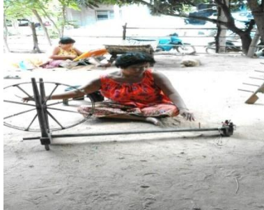
ภาพที่ 5 การปั่นหลอด

เส้นฝ้ายคล้องใส่กงซึ่งวางอยู่ระหว่างตีนกง 1 คู่ หมุนกงคล้ายฝ้ายออกจากกง พันเข้าสู่ที่เตรียมไว้ ซึ่งจะเป็นหลอดที่ทำด้วยไม้ไผ่หรือหลอดพลาสติกก็ได้ที่มี ขนาดเหมาะสมสามารถสวมในกระสวยได้ โดยเสียบแน่นอยู่กับเหล็กในของ เหลลา ผู้ทำการปั่นหลอดจะทำการ หมุนกงลื้อไม้ไผ่ของเหลลา เหล็กใน ซึ่งจะทำให้หลอดหมุนเอาเส้นฝ้าย จากกงพันเข้าสู่รอบแกนหลอดไม้ไผ่ จะเต็มหลอดตามความเหมาะสม ตามที่ต้องการของผู้ปั่นหลอดให้ได้ ขนาดที่เหมาะสมของร่องกระสวย ทอผ้า(ภาพที่ 5)