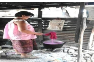
ภาพที่ 1 ฝ้ายดิบด้วยสีสกัดจากธรรมชาติ

นำเส้นฝ้ายดิบที่เตรียมไว้ ไปย้อมด้วยสีสกัดจากธรรมชาติตามที่ต้องการด้วยสีต่างๆ จนกว่าสีจะร่วมเป็นเนื้อเดียวกับเส้นฝ้าย ประมาณ 2-3 รอบ (ภาพที่ 1) จากนั้นนำเส้นฝ้ายที่ได้จากการย้อมไปผึ่งตากแดดให้แห้ง เมื่อเส้นฝ้ายที่ย้อมสีแห้งสนิทแล้วเส้นฝ้ายจะถูกนำไปเข้าสู่การคลี่ใจฝ้าย เพื่อให้เส้นฝ้ายมีความอ่อนนุ่มสามารถทอได้สะดวก จากนั้นนำเส้นฝ้ายที่ได้ใส่ลงในกงเพื่อกรอใส่อঁกเพื่อเตรียมไว้สำหรับกรรมวิธีการคันเส้นฝ้ายต่อไป (ภาพที่ 2)