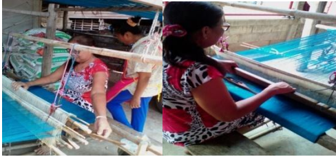
ภาพที่ 10 การทอผ้าไหมมัดหมี่

พุ่ง) ที่เตรียมไว้ในหลอดพุ่งไปขัดกับเส้นยืน และใช้พิมพ์ดินให้เส้นให้เส้นพุ่งอัดเรียงตัวกันแน่น 1-2 ครั้งเพื่อให้เกิดความแน่น แล้วใช้เท้าเหยียบไม้เหยียบให้ตะกอลเส้นยืนสลับลงไปมา และพุ่งกระสวยกลับไปกลับมาขัดกับเส้นยืน หลังจากตีพุ่งเส้นพุ่งไปมา และใช้พิมพ์ดินให้แน่นหลาย ๆ ครั้งจนกว่าจะได้ขนาดตามที่ต้องการ ซึ่งโดยส่วนใหญ่ใน 1 หูก จะสามารถผลิตได้ 4-6 ผืน ขึ้นอยู่ความยาวและขนาดที่ต้องการของผืนผ้าที่ผู้ต้องการ (ภาพที่ 10)