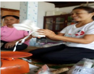
ภาพที่ 5 จัดทรงลูกประคบและมัดเชือก

เมื่อได้น้ำหนักตามกำหนดแล้ว เริ่มต้นจับมูมผ้าที่ละ 2 มูม ขึ้นมาทับกัน จับจนครบทั้ง 4 มูม ให้รวบมูมผ้าที่ละมูม อีกครั้งหนึ่ง จนครบทั้ง 4 มูม แต่งชายผ้าให้เรียบร้อย ค่อย ๆ จัดให้เป็นลูกทรงกลมแล้วมัดด้วยเชือกให้แน่นแล้วบรรจุลงถุงพลาสติก