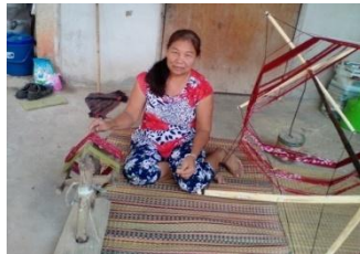
ภาพที่ 9 การแกว่งหมี่