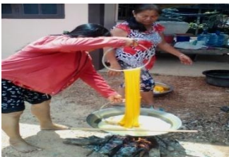
ภาพที่ 1 การฟอกไหม

เมื่อผู้ผลิตได้เส้นที่ได้จากการสาวไหมเป็นไหมดิบที่ยังไม่สามารถทำการทอได้ ซึ่งไหมดิบที่ได้จะถูกนำไปทำการฟอกไหมเพื่อให้ไหมมีความอ่อนตัวด้วยสารที่มีปฏิกิริยาเป็นด่างผสมกับน้ำแล้วต้มให้เดือด เพื่อให้เส้นไหมอ่อนตัว และใช้มือสัมผัสเส้นไหมเพื่อทดสอบดูว่าเส้นไหมมีความอ่อนนุ่มลื่นแล้วหรือยัง จากนั้นนำเส้นไหมที่ผ่านการฟอกไปล้างด้วยน้ำสะอาดและนำไปตากให้แห้ง(ภาพที่ 1-4)