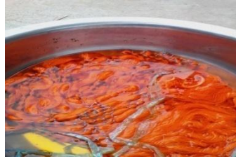
ภาพที่ 7 การย้อมไหม