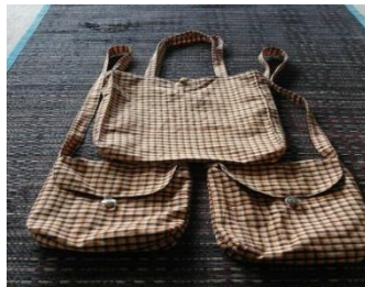
ภาพที่ 8 กระเป๋าผ้าฝ้าย