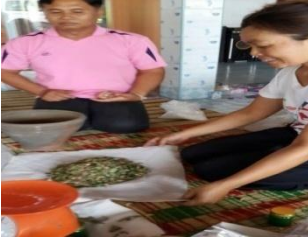
ภาพที่ 3 เทสมุนไพรที่ผสมกันลงผ้า

นำส่วนผสมทั้งหมดวางตรงกลางของผ้า ชั่งน้ำหนักให้ได้น้ำหนักตามกำหนด