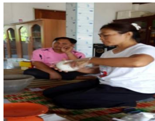
ภาพที่ 6 บรรจุลงถุงพลาสติก