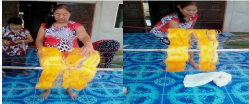
ภาพที่ 5 การกวักและแกว่งไหม

เมื่อนำไหมไปตากแห้งสนิทแล้วเส้นไหมที่ได้จะถูกนำไปเข้าสู่กระบวนการกวักใส่ถัก จากนั้นทำการแกว่งไหมเพื่อนำเส้นไหมที่ได้ไปซิงกับโองไหมเพื่อมัดหมี่เป็นลวดลายต่างๆตามที่ต้องการต่อไป(ภาพที่ 5)