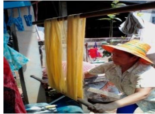
ภาพที่ 3 การตากเส้นไหม