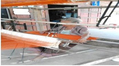
ภาพที่ 6 การทอผ้าฝ้าย