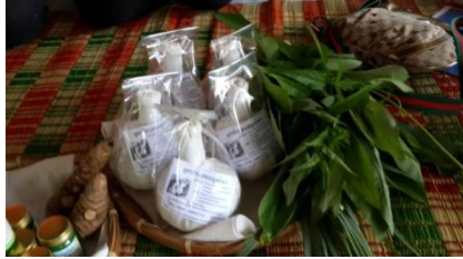
ภาพที่ 7 ลูกประคบสมุนไพร