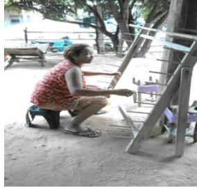
ภาพที่ 3 การคันฝ้ายในหลักเพียว

นำเส้นฝ้ายที่ผ่านกระบวนการกรอไส้อัก มาการคลี่ไส่กับเพียวขอหรือหลักเพียว เพื่อให้เส้นฝ้ายสามารถเรียงตัวในลักษณะของเส้นยืนตามลักษณะความยาวที่ต้องการ เพื่อที่จะเข้าสู่กระบวนการสีเส้นฝ้ายต่อไป (ภาพที่ 3)