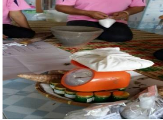
ภาพที่ 4 ชั่งน้ำหนักส่วนผสม