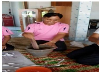
ภาพที่ 2 การโขลกสมุนไพร