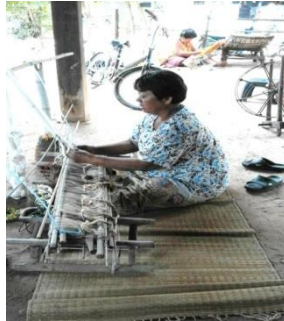
ภาพที่ 4 การสีเส้นฝ้ายในลักษณะเส้นยืน

การสีเส้นฝ้ายเป็นการสีเส้นฝ้ายทางยืนเข้ากับแกนม้วนด้ายยืน จากนั้นทำการร้อยปลายเส้นด้ายแต่ละเส้นเข้าในตะกอกเพื่อเตรียมสำหรับทอในเส้นยืนและเส้นนอน ซึ่งในแต่ละชุดจะทำการพันหวีดึงปลายเส้นด้ายยืนทั้งม้วนเข้ากับแกนม้วนผ้า ตลอดจนอีกด้านหนึ่งจะไม่ดึงเส้นฝ้ายมากจนเกินไป ซึ่งจะเหลือไว้เพื่อให้สามารถปรับความตึงหย่อนของการทอให้มีความให้พอเหมาะสำหรับการทอ(ภาพที่ 4)