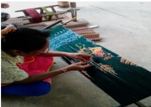
ภาพที่ 8 การแก้มี่

ภายหลังจากเสร็จสิ้นการย้อมสีตามที่ต้องการแล้ว เมื่อสีสามารถจับกับเส้นไหมและแห้งสนิทดีแล้ว ซึ่งผ่านกระบวนการมัดหมี่เป็นที่เรียบร้อยแล้ว แล้วนั้น ก็จะนำเส้นไหมที่มัดหมี่มาทำการชิงกับโองหมี่อีกครั้งหนึ่ง เพื่อเข้าสู่กระบวนการแก้มี่โดยใช้มีดในการตัดเชือกฟางออกอย่างเบามือ เพื่อป้องกันไม่ให้เส้นไหมขาด (ภาพที่ 8) จากนั้นนำเส้นไหมที่ผ่านการมัดหมี่ออกจากโองหมี่ และนำใส่ในกงเพื่อแกว่งไหมใส่ในอีกอีกครั้งหนึ่ง ก่อนที่จะนำไหมกรอใส่ในหลอดเพื่อเตรียมสำหรับการทอต่อไป (ภาพที่ 9)